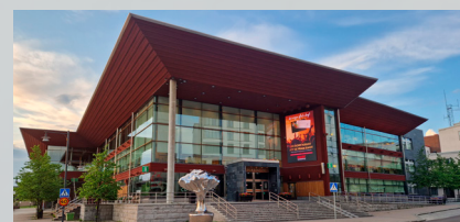
På torsdagskvällen arrangeras en konferensmiddag på Kulturens Hus.