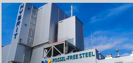
På torsdagen finns det möjlighet att följa med på studiebesök till HYBRIT